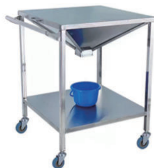
不锈钢清创车 P09 Stainless steel debriding cart