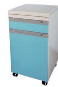
钢塑床头柜 S09 Steel plastic bedside cabinet 尺寸 (size) : 440*460*765mm