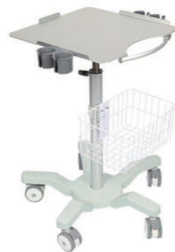
超声台车 P05 Ultrasonic trolley