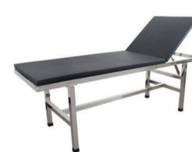
不锈钢起背诊疗床 ZL-6