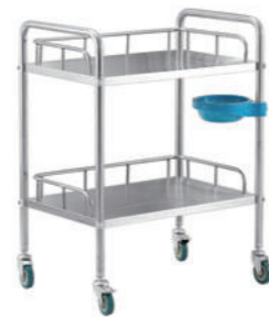
不锈钢器械车 R01 Stainless steel apparatus vehicle 尺寸 (size) : 660*440*860mm