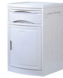
ABS床头柜 S03 ABS bedside cabinet 尺寸 (size) : 480*480*760mm