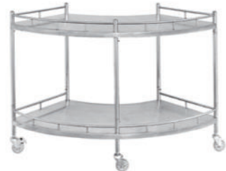
不锈钢扇形器械台 P06 Stainless steel fan shaped instrument table