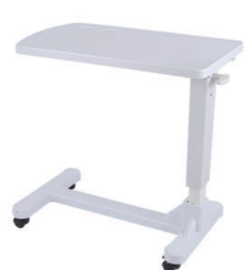
移动餐桌 S13 Movable dining table