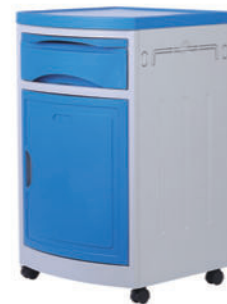
ABS床头柜 S06 ABS bedside cabinet 尺寸 (size) : 480*480*800mm