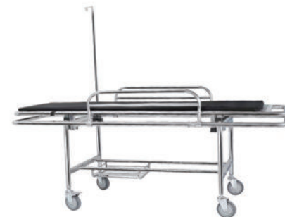
担架车 P11 Stretcher cart