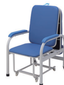
陪护椅 T09 Accompany chair