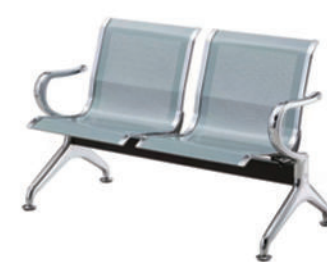
候诊椅 T05 Waiting room chair