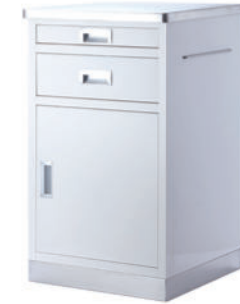
钢塑床头柜 S07 Steel plastic bedside cabinet 尺寸 (size) : 480*480*780mm