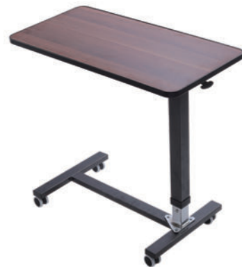
移动餐桌 S12 Movable dining table