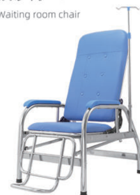
不锈钢输液椅 T11 Stainless steel infusion chair