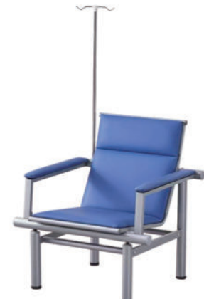
输液椅 T02 Infusion chair