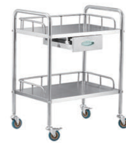
不锈钢治疗车 R02 Stainless steel treatment vehicle 尺寸 (size) : 660*440*860mm