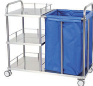
不锈钢晨护车 P10 Stainless steel morning care cart