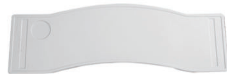
ABS餐桌 S14 ABS dining board