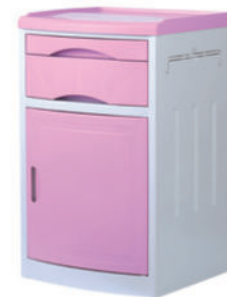
ABS床头柜 S02 ABS bedside cabinet 尺寸 (size) : 480*480*760mm