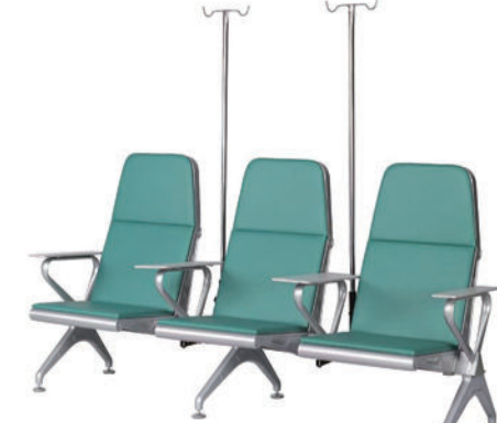
输液椅 T04 Infusion chair