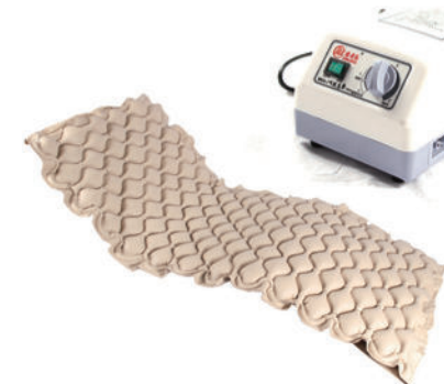
防褥疮气垫 Z46 (球型波动)