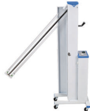
紫外线消毒灯 P08 Ultraviolet sterilization light