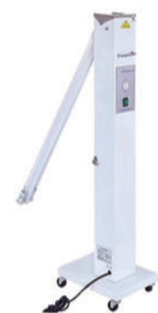
紫外线消毒灯 P07 Ultraviolet sterilization light