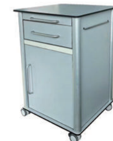
抗碯特床头柜 S08 Compact Laminated bedside cabinet 尺寸 (size) : 480*480*725mm