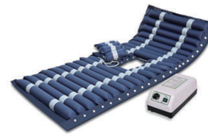
防褥疮气垫 Z45 (护理床专用)