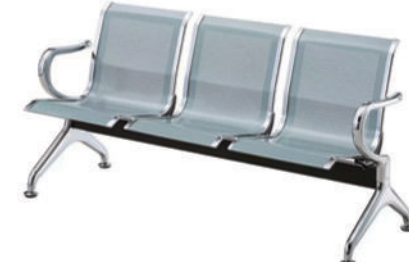
候诊椅 T06 Waiting room chair