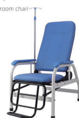
输液椅 T12 Infusion chair