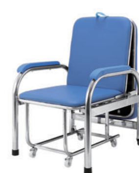
不锈钢陪护椅 T10 Stainless steel accompanying chair