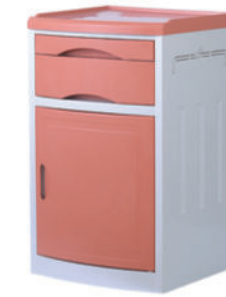
ABS床头柜 S04 ABS bedside cabinet 尺寸 (size) : 480*480*760mm