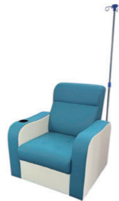
输液椅 T01 Infusion chair