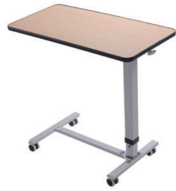
移动餐桌 S11 Movable dining table