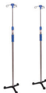
输液架 S16 Infusion stand