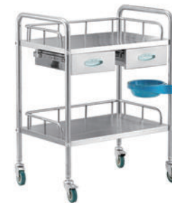
不锈钢双抽治疗车 R03 Stainless steel treatment vehicle 尺寸 (size) : 660*440*860mm