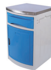
ABS床头柜 S01 ABS bedside cabinet 尺寸 (size) : 480*480*760mm