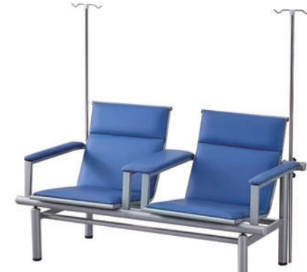
输液椅 T03 Infusion chair