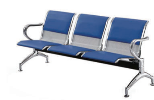
候诊椅 T08 Waiting room chair