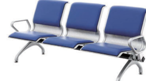
候诊椅 T07 Waiting room chair