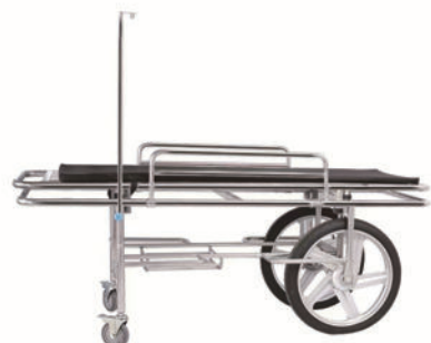
担架车 P12 Stretcher cart