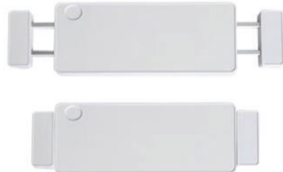
ABS伸缩餐桌 S15 ABS stretchable dining board