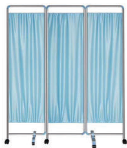
不锈钢屏风 P13 Stainless steel screen