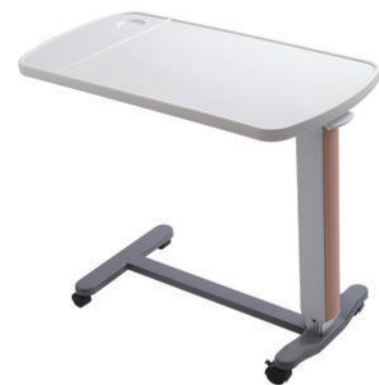
移动餐桌 S10 Movable dining table