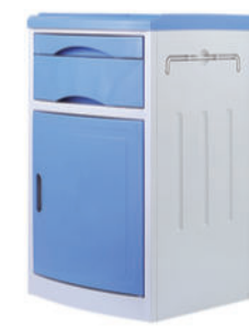
ABS床头柜 S05 ABS bedside cabinet 尺寸 (size) : 480*480*760mm