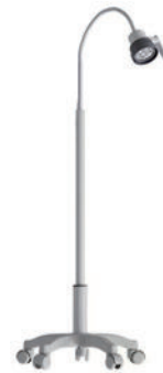
手术照明灯 P03 Surgical lamp